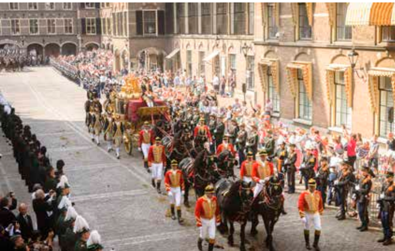
Gouden koets Binnenhof

Langs de route van de Gouden Koets, op het Binnenhof en voor het paleis Noordeinde komen ieder jaar weer veel mensen het spektakel bekijken.