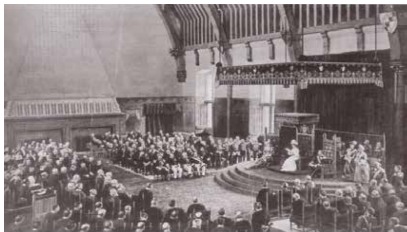
Koningin Wilhelmina, troonrede 1904

De rede bevatte allerlei algemene (standaard)opmerkingen over de staat van het land. Het ging daarbij bijvoorbeeld over de betrekkingen met het buitenland, eventuele militaire verrichtingen, de toestand in de koloniën en de resultaten van landbouw, nijverheid en handel. Meestal werd tevens iets gezegd over de begroting en over te nemen belastingmaatregelen. In 1822 zei de koning bijvoorbeeld: De berekening dier uitgaven, welke aan Uwe Vergadering zal worden voorgelegd, is beneden de raming over het loopende jaar, niettegenstaande de rente van de nieuwe schuld, voor buitengewone behoeften gecreëerd, daar in is moeten worden opgenomen. Eene vermindering van opcenten zal dus mogelijk zijn.