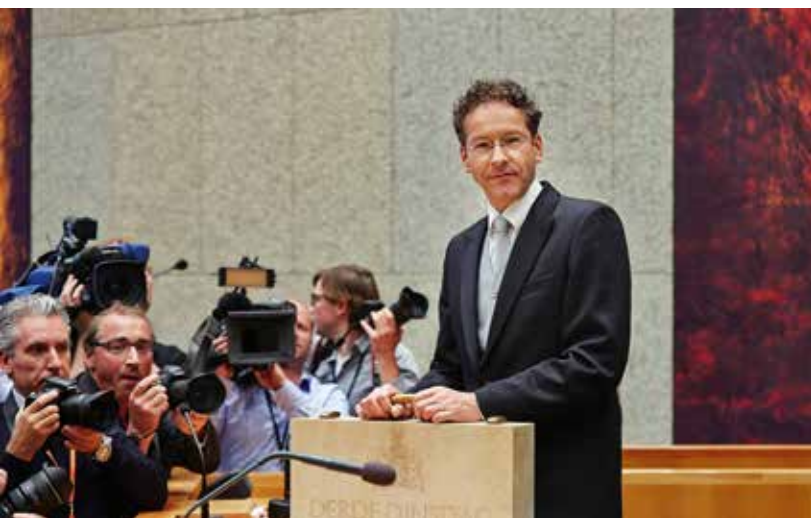
Aanbieden koffertje Tweede Kamer

Op het koffertje staat aan één kant de tekst 'derde dinsdag in september'. Op de andere kant staat 'Je maintiendrai' (Frans voor 'ik zal handhaven'), de lijfspreuk van Nederland. Het koffertje is een geschenk van de Staatsdrukkerij. Het is gemaakt van geitenperkament. Van binnen is het bekleed met blauwe zijde.