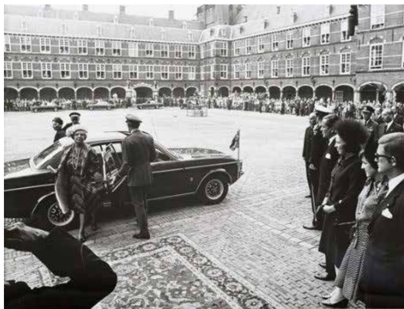
Koningin Juliana per zwarte limousine in 1974

Een van de meest bijzondere Prinsjesdagen was die van 1974. Niet per Gouden Koets, maar met een zwarte limousine kwamen koningin Juliana en prins Bernhard naar de Ridderzaal. Vlak bij het Binnenhof was in de Franse ambassade een gijzeling gaande. Daarom werd het 'niet gepast' geacht om met de bekende pracht en praal Prinsjesdag te organiseren. Op straat is in Den Haag niets feestelijks te bespeuren, de stoet naar de Ridderzaal neemt een andere route – uit de buurt van de Franse ambassade aan het Korte Voorhout, waar drie Japanse terroristen elf mensen gijzelen.