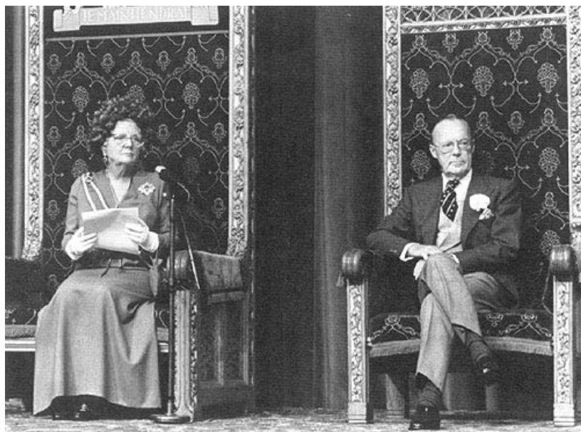
Koningin Juliana en Prins Bernhard Ridderzaal

Koning Willem Alexander werd in 2013 begeleid door zijn vrouw koningin Maxima en door zijn broer en schoonzus prins Constantijn en prinses Laurentien. Voor het eerst zat op het podium naast een koning diens echtgenote. Prinses Beatrix en prinses Margriet en prof. mr. Pieter van Vollenhoven waren er niet meer bij.