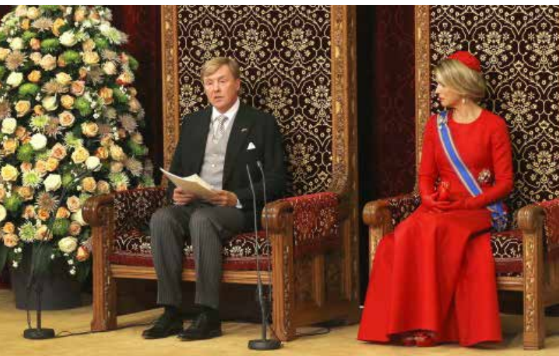
Koning Willem-Alexander leest de Troonrede

Na zijn rit in de Gouden Koets stapt de koning uit voor de deur van de Ridderzaal op het Binnenhof. Begeleid door een 'commissie van in- en uitgeleide', bestaande uit Eerste en Tweede Kamerleden, gaat hij de Ridderzaal in en leest daar om 13:15 uur de troonrede voor.