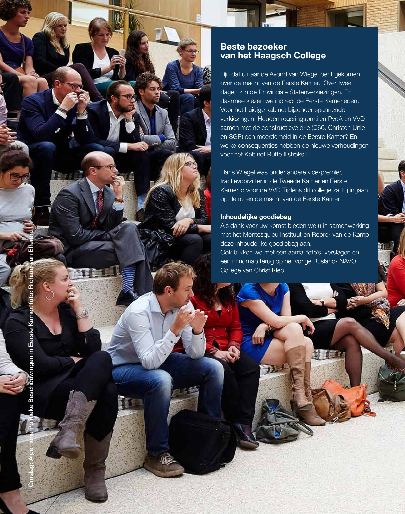
Omslag: Algemene Politieke Beschouwingen in Eerste Kamer, foto: Richard van Elferen.