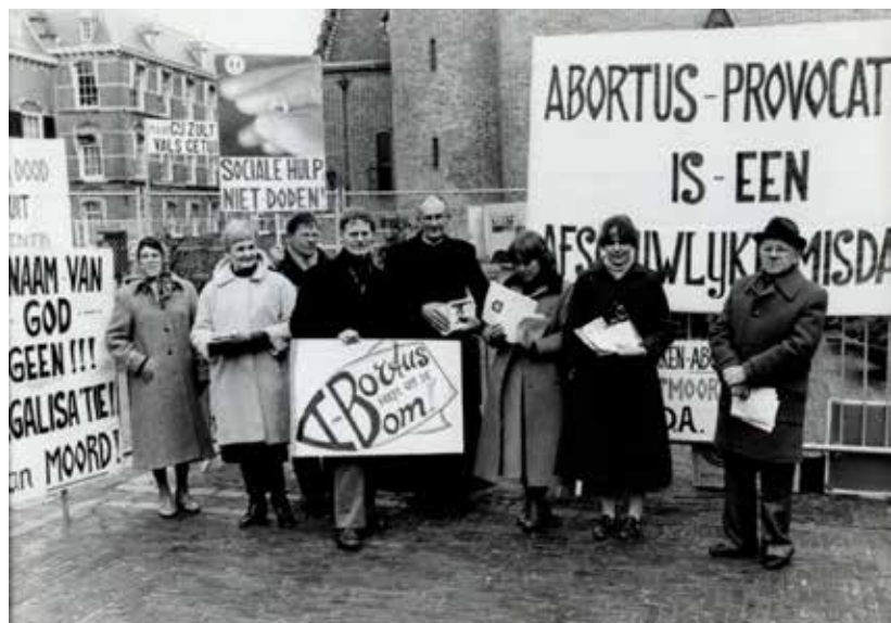
Protesten op het Binnenhof tegen regeling abortus provocatus.

Een wetsvoorstel van de VVD'er Ruud Luchtenveld om het mogelijk te maken zonder rechterlijke tussenkomst een echtscheiding te regelen en voortgezet ouderschap te regelen, werd in 2006 verworpen. Alleen D66 stemde voor het wetsvoorstel. In 2008 kwam een wet tot stand die vooral het voortgezette ouderschap na echtscheiding regelde.