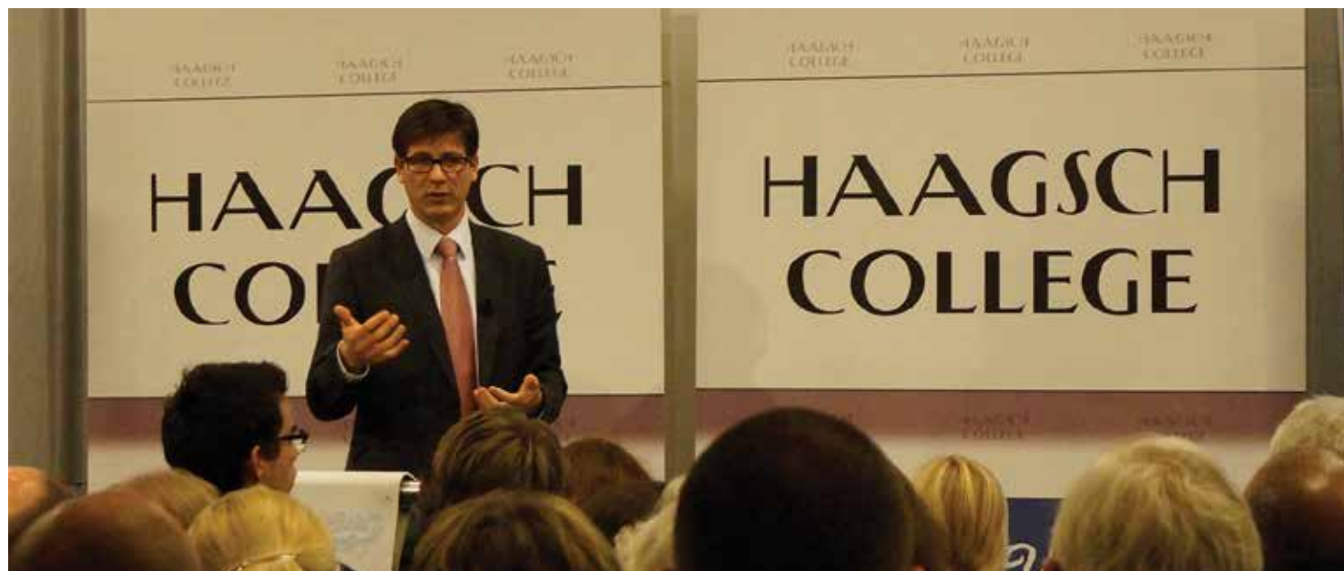
Hoogleraar en directeur van Centre for Terrorism & Counterterrorism, Campus Den Haag