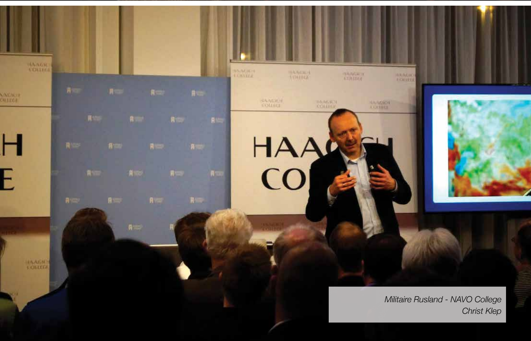
Militaire Rusland - NAVO College Christ Klep