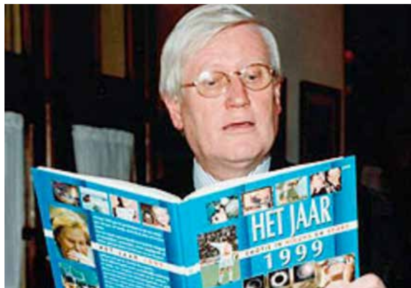
De verwerping van het voorstel correctief referendum in 1999 werd bekend als 'de Nacht van Wiegel'.

Omdat bij de tweede lezing op één stem na geen tweederde meerderheid werd gehaald, sneuvelde het voorstel om invoering van een correctief referendum mogelijk te maken.