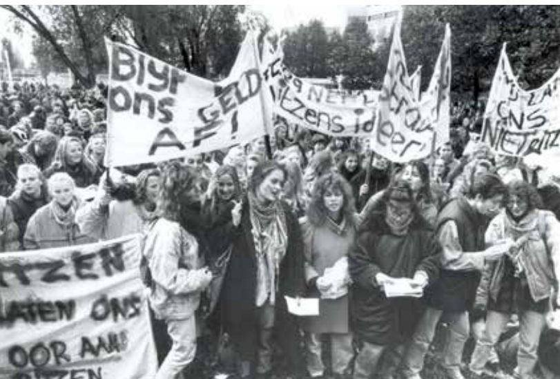
Demonstraties tegen minister Ritzen.

Minister Ritzen op de laatste dag van de aftredende Eerste Kamer een wetsvoorstel sneuvelen, waarin studiefinanciering werd gekoppeld aan studieprestaties. Omdat een VVD-lid en een D66-lid (die beiden niet zouden terugkeren in de nieuwe Senaat) met de oppositie meestemden, werd het voorstel met één stem verschil verworpen. Een jaar later werd een nieuw voorstel wel aangenomen.