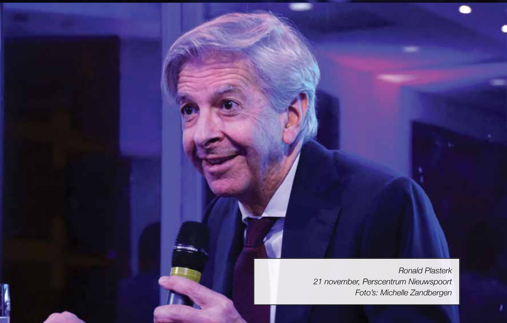
Ronald Plasterk 21 november, Perscentrum Nieuwspoord