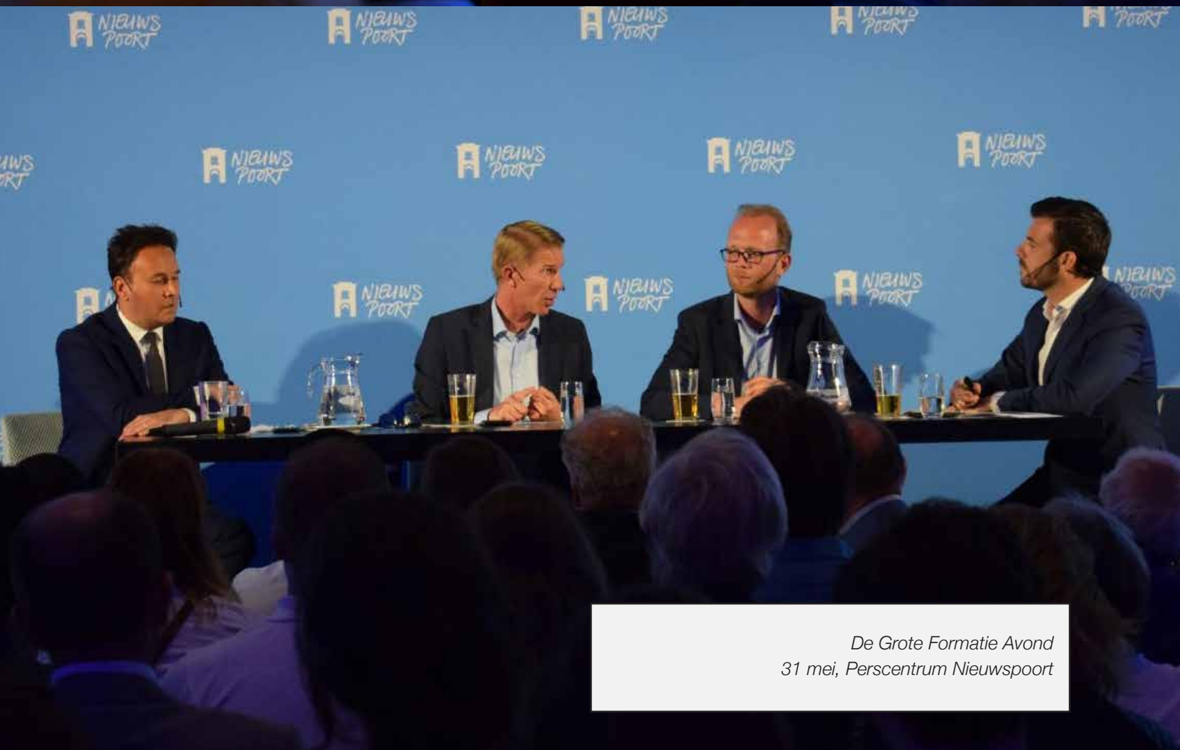
De Grote Formatie Avond 31 mei, Perscentrum Nieuwspoor