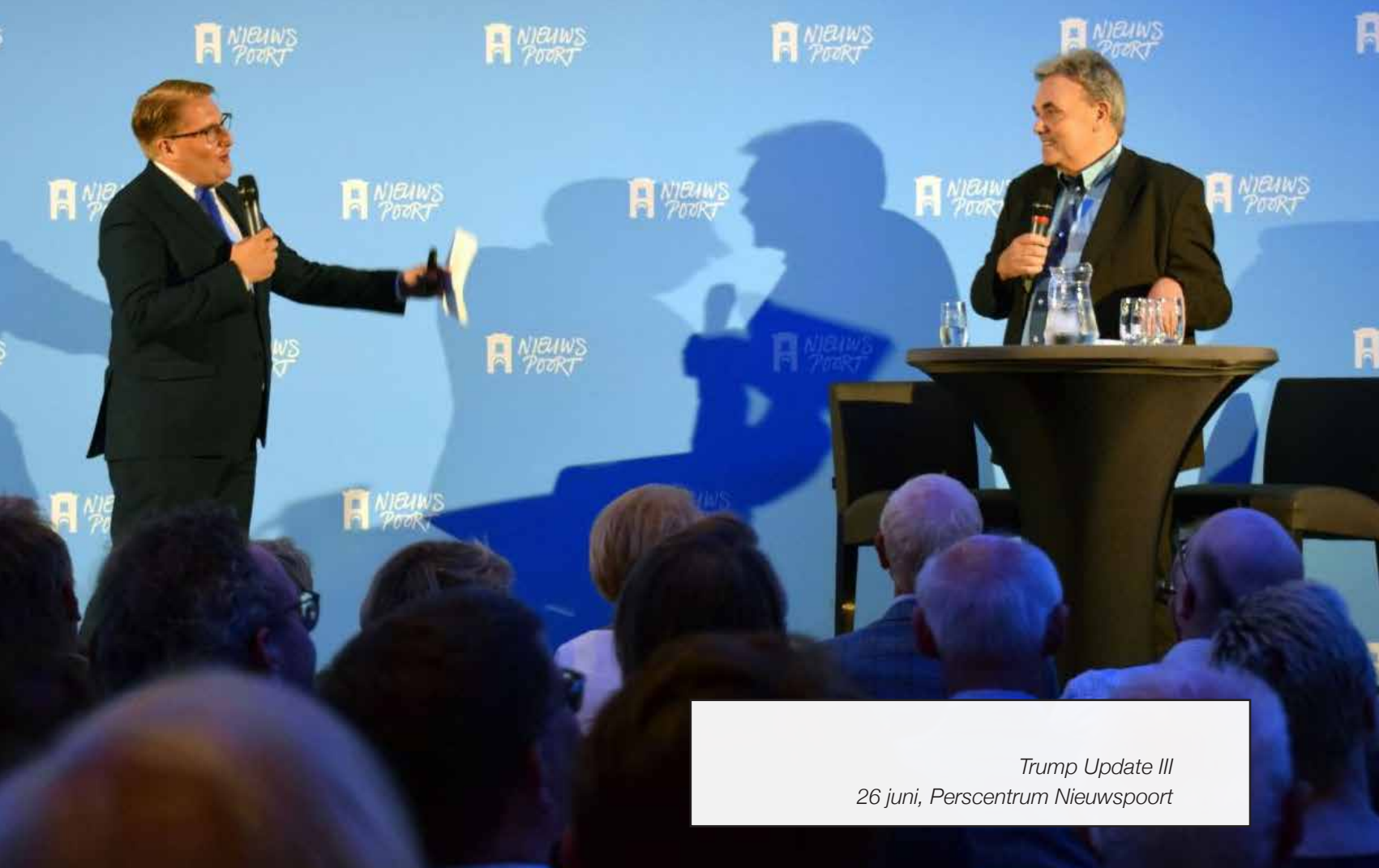
Trump Update III 26 juni, Perscentrum Nieuwspoor