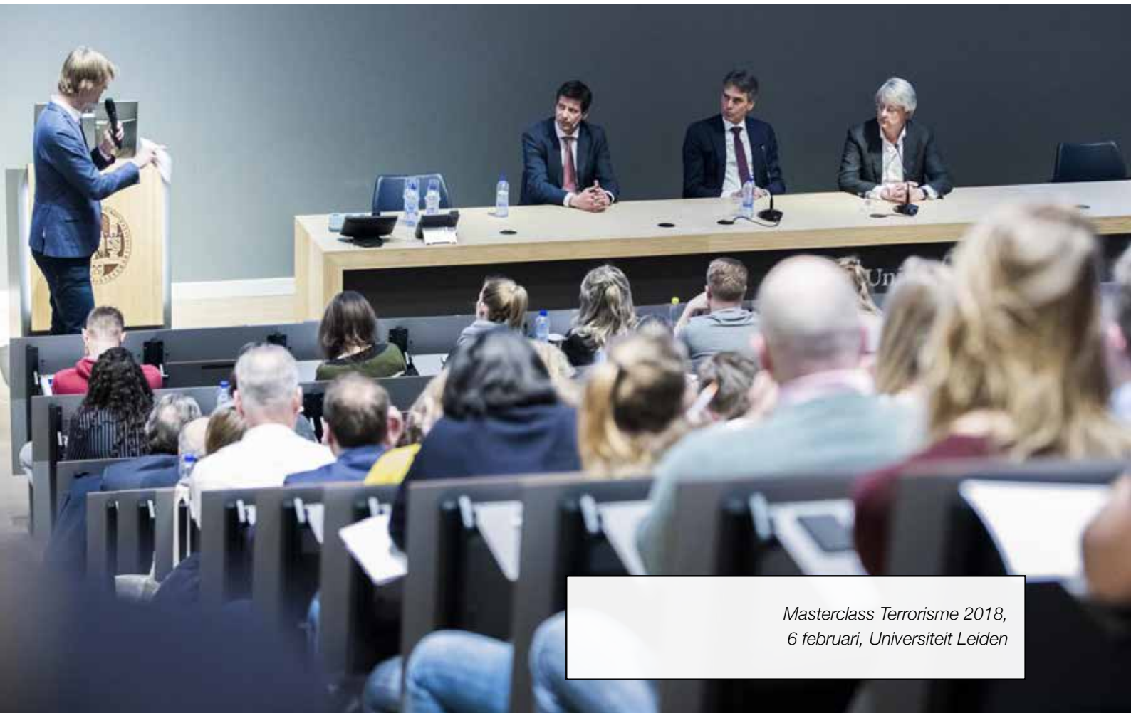
Masterclass Terrorisme 2018, 6 februari, Universiteit Leiden