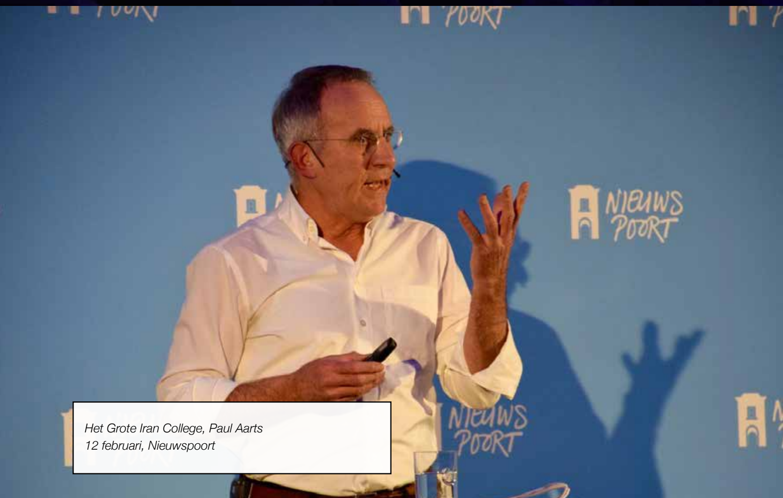
Het Grote Iran College, Paul Aarts 12 februari, Nieuwspoot