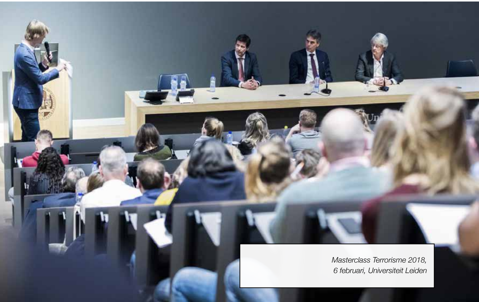
Masterclass Terrorisme 2018, 6 februari, Universiteit Leiden