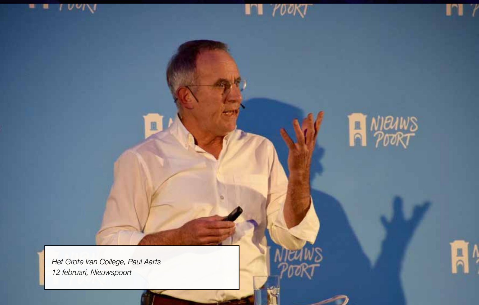
Het Grote Iran College, Paul Aarts 12 februari, Nieuwspoot