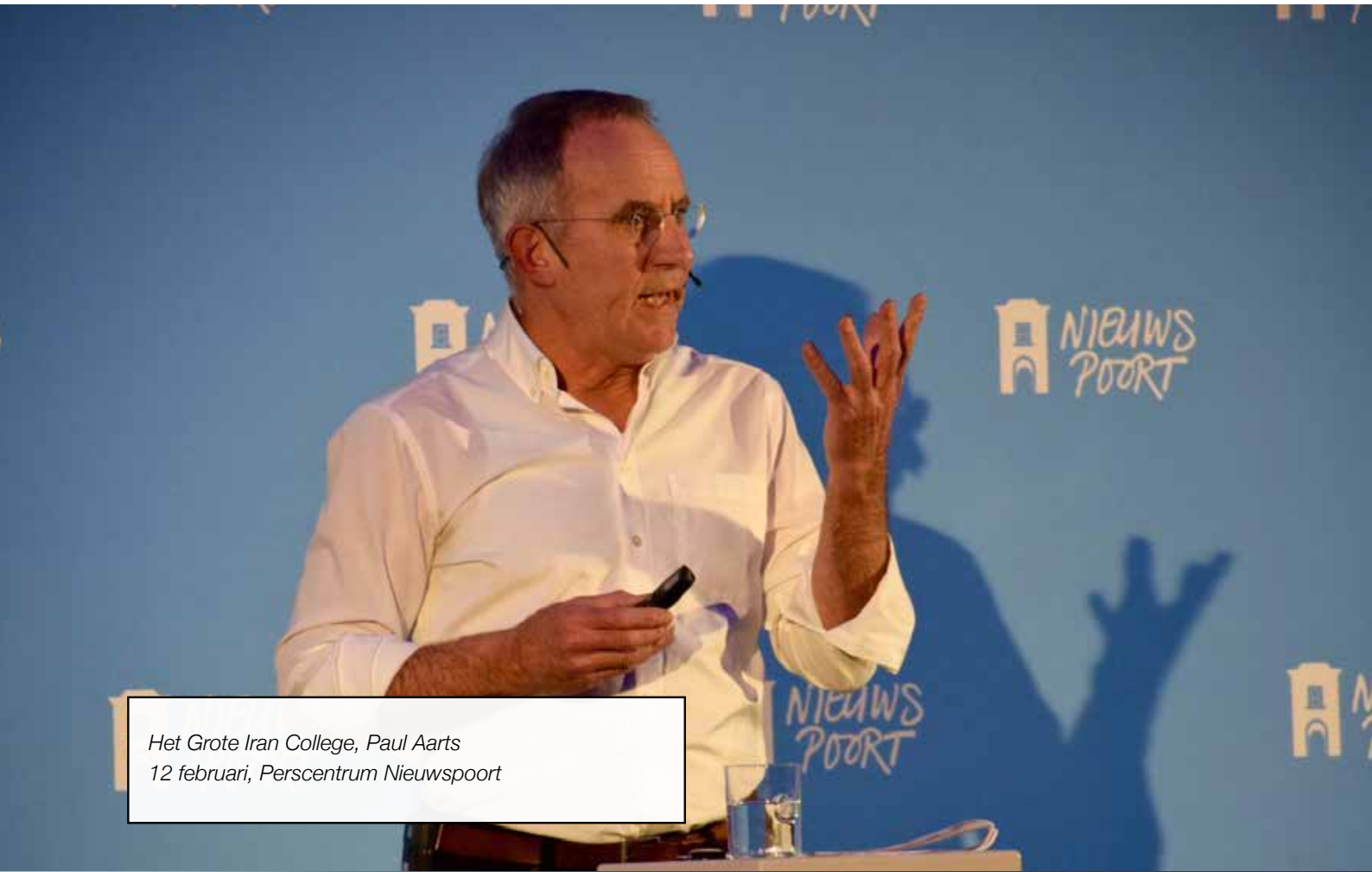
Het Grote Iran College, Paul Aarts 12 februari, Perscentrum Nieuwspoord