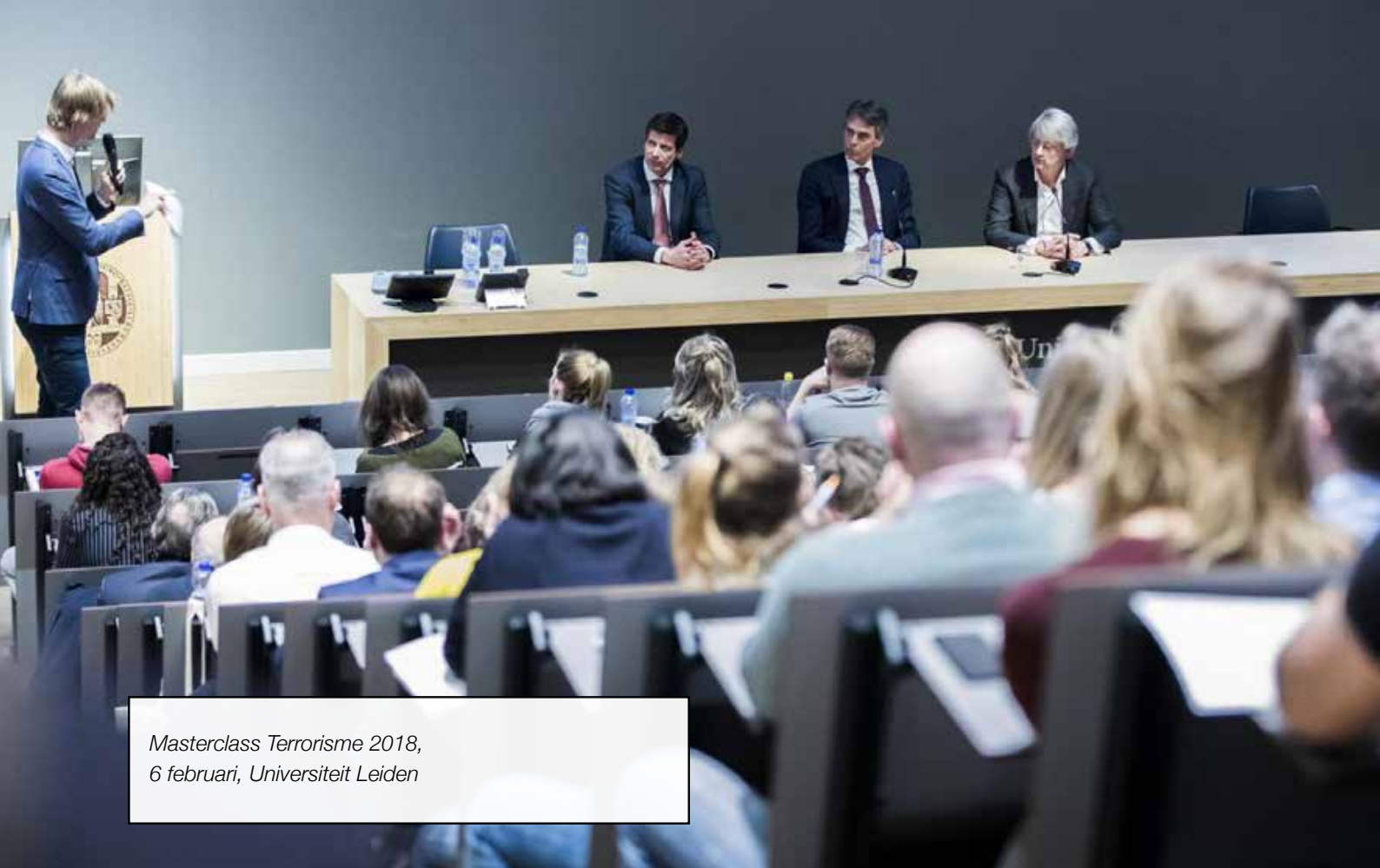
Masterclass Terrorisme 2018, 6 februari, Universiteit Leiden