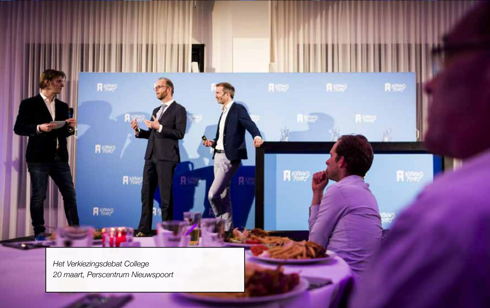
Het Verkiezingsdebat College 20 maart, Perscentrum Nieuwspoor