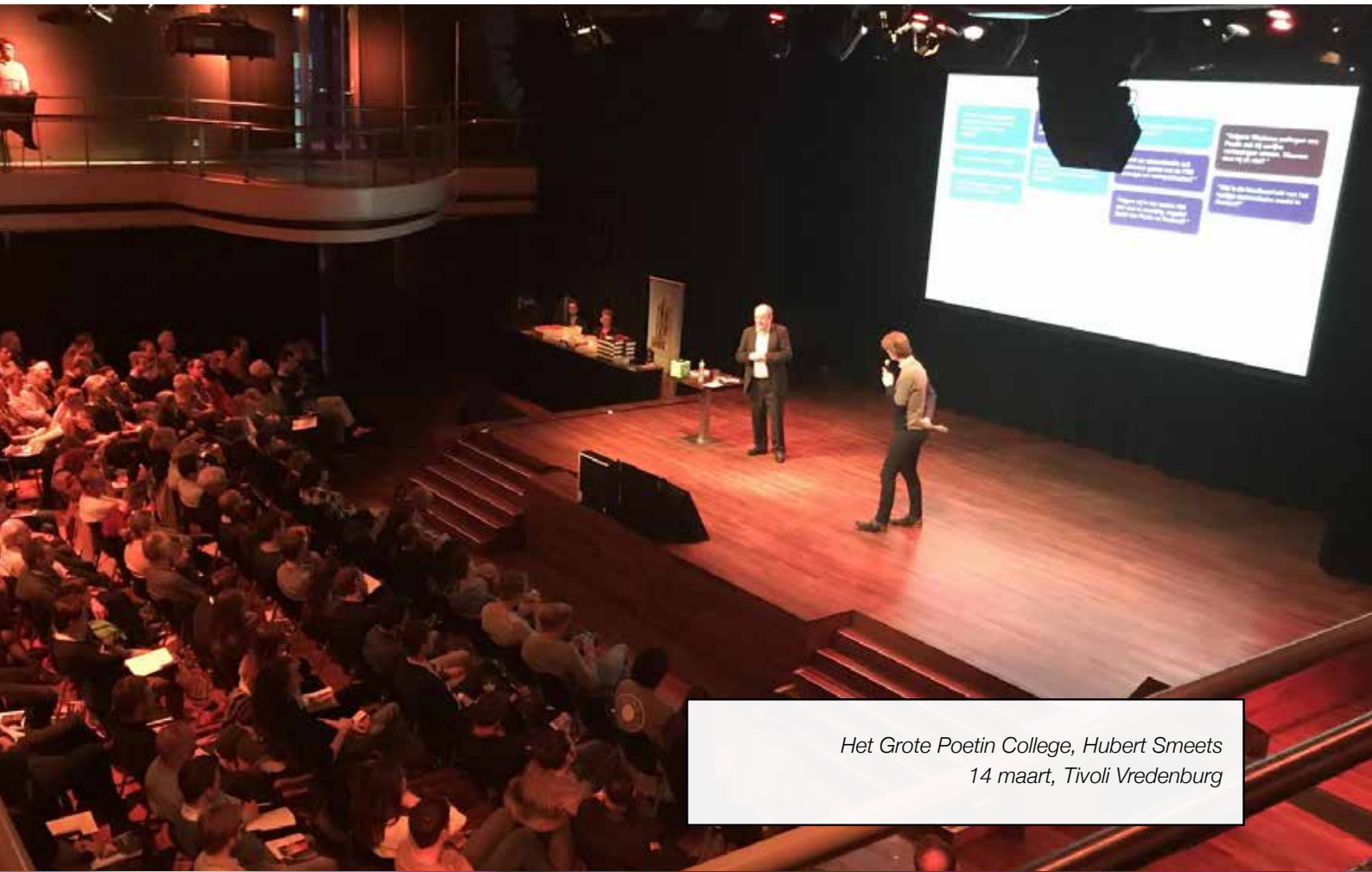
Het Grote Poetin College, Hubert Smeets 14 maart, Tivoli Vredenburg