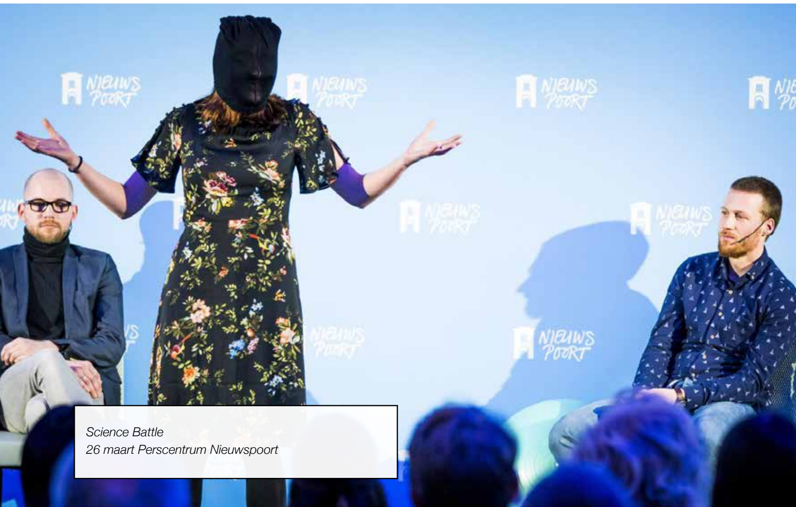
Science Battle 26 maart Perscentrum Nieuwspoor