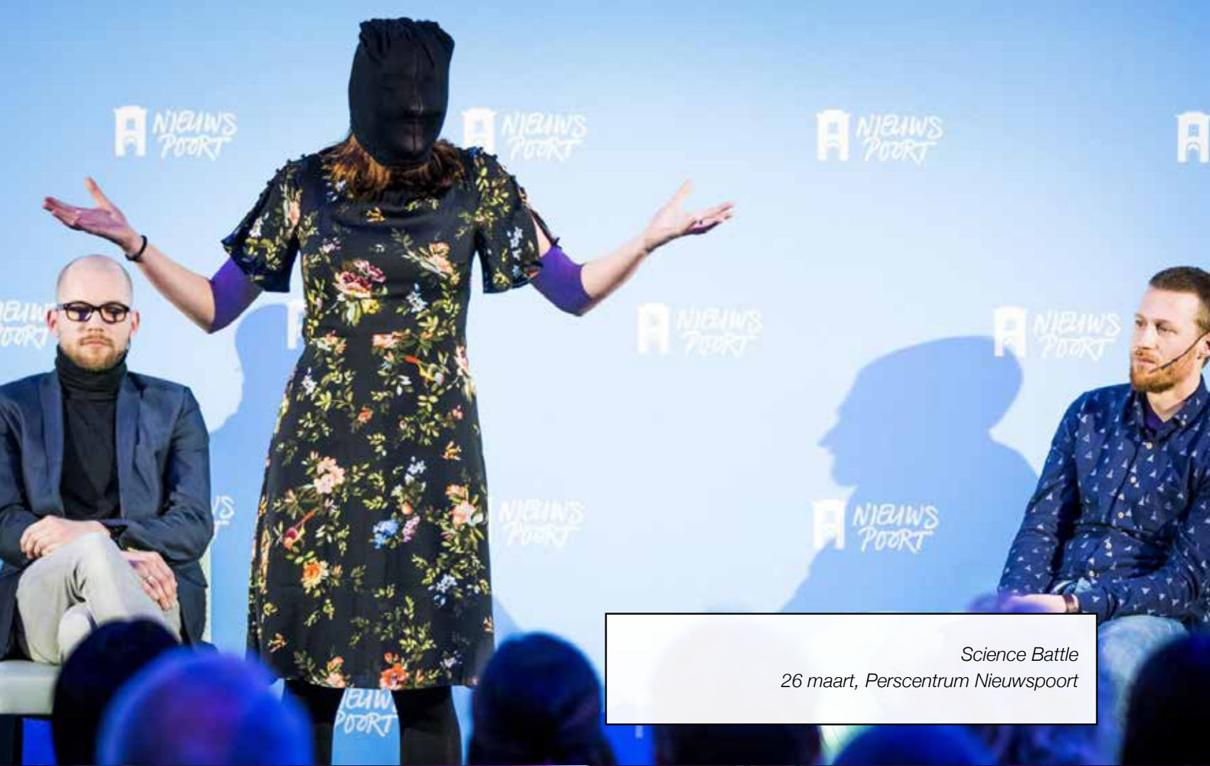
Science Battle 26 maart, Perscentrum Nieuwspoor