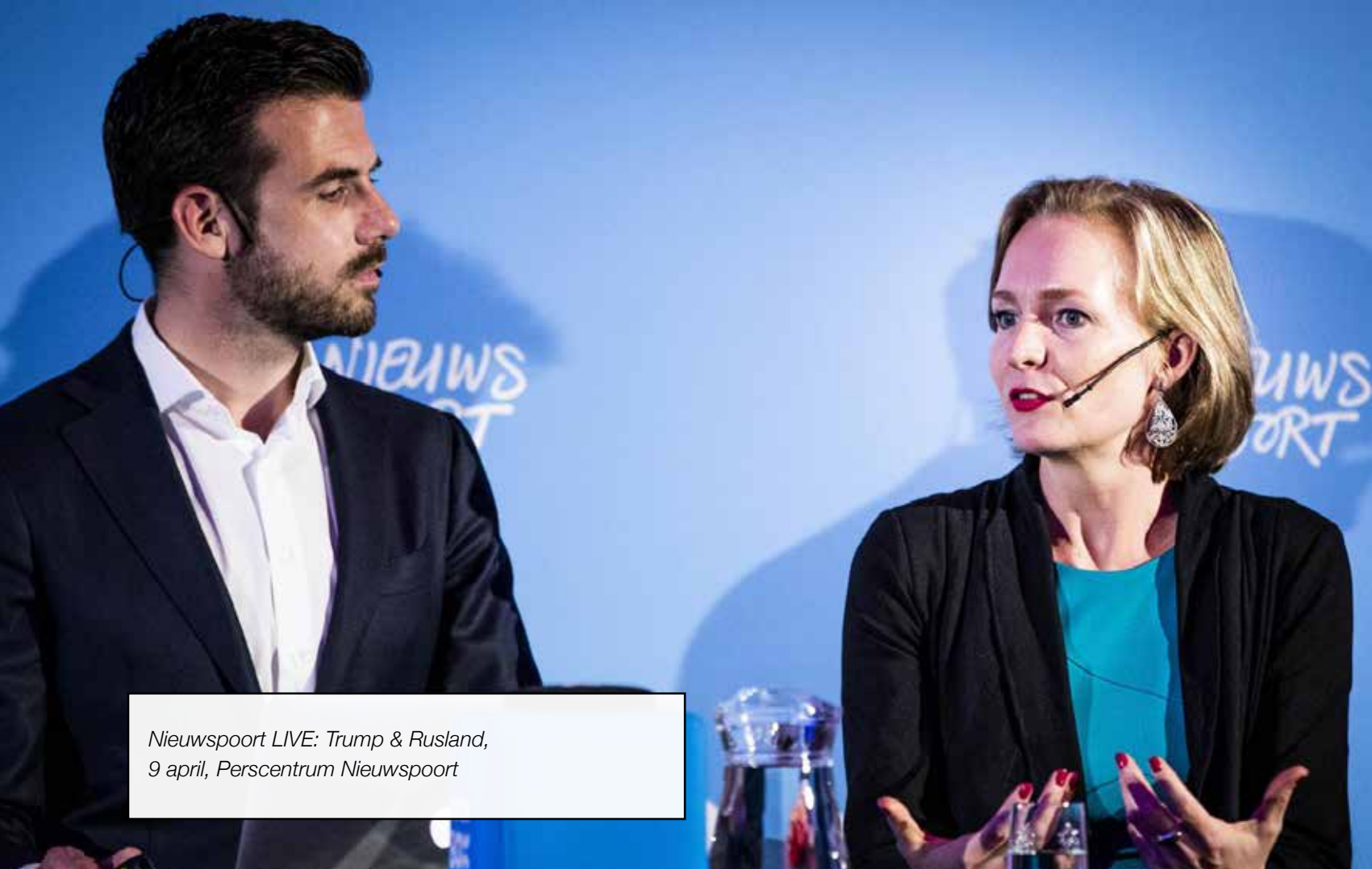
Nieuwspoor LIVE: Trump & Rusland, 9 april, Perscentrum Nieuwspoor