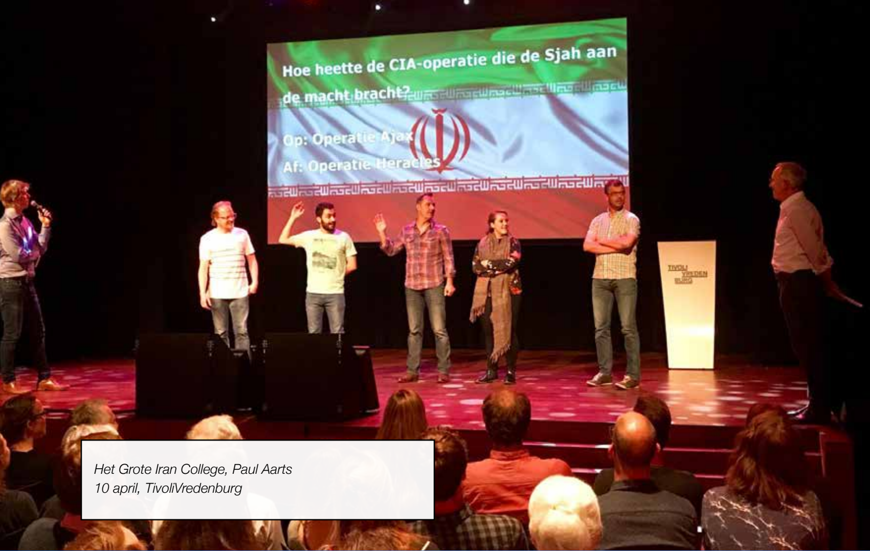
Het Grote Iran College, Paul Aarts 10 april, TivoliVredenburg