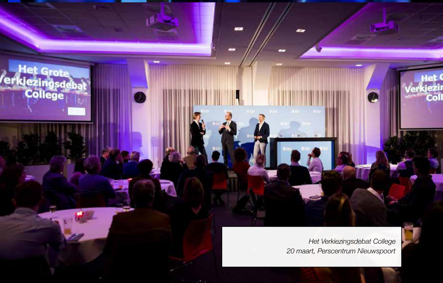
Het Verkiezingsdebat College 20 maart, Perscentrum Nieuwspoor