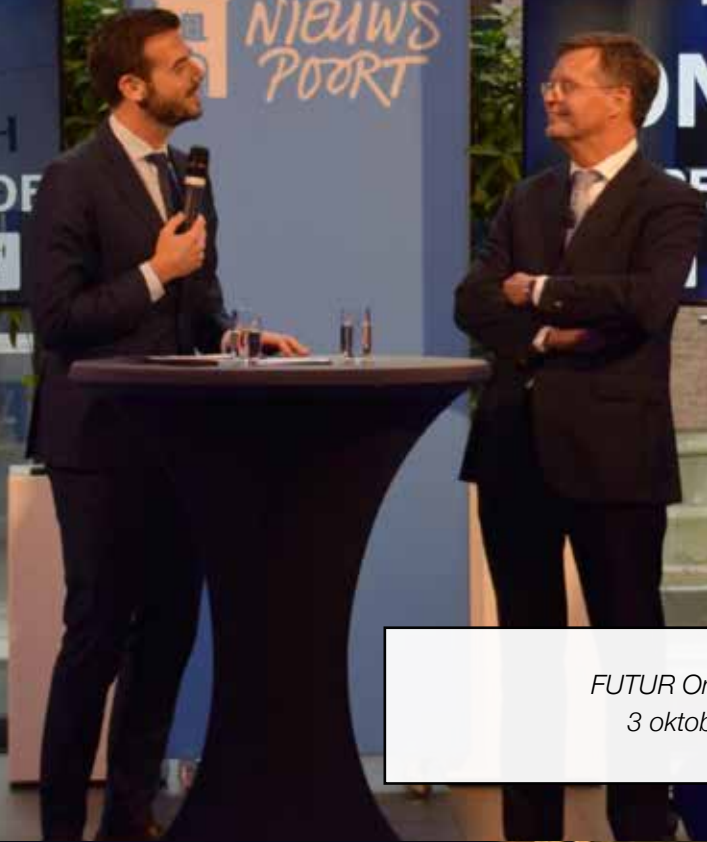
FUTUR Ontmoet: Jan Peter Balkenende 3 oktober, Perscentrum Nieuwspoor

FUTUR ONTMOET: HAAGSCH PETER BALKENENDE HAAGSCH COLLEGE