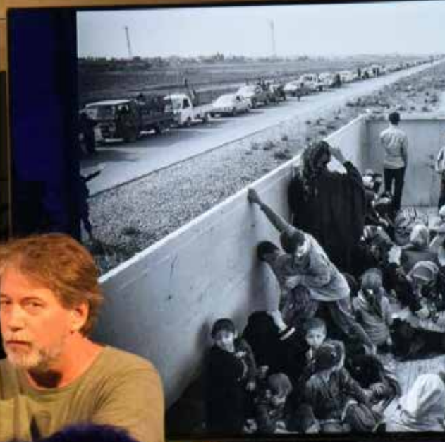
Het Grote Oorlogsfotografie College 22 september, Perscentrum Nieuwspoor