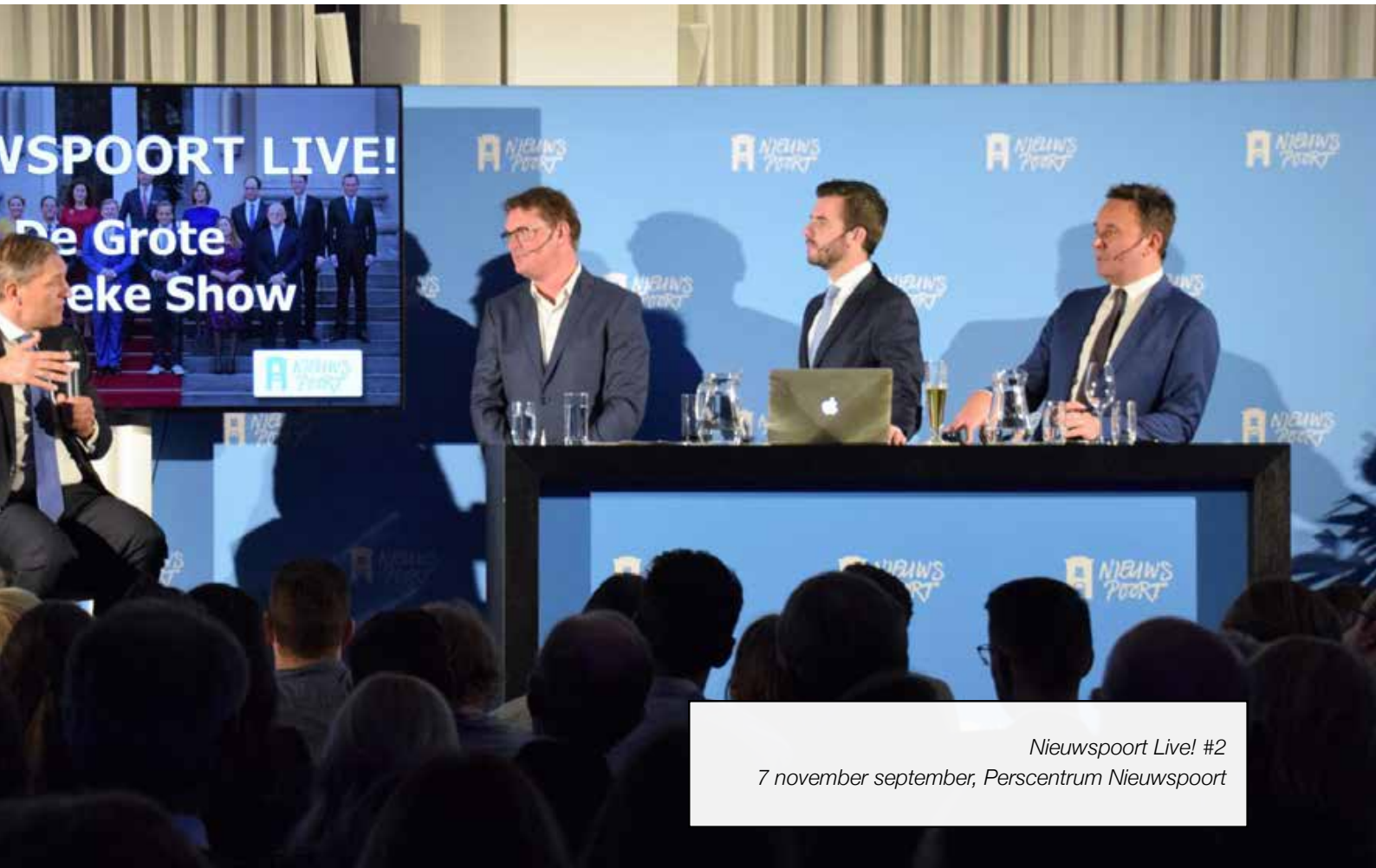
Nieuwspoord Live! #2 7 november september, Perscentrum Nieuwspoord