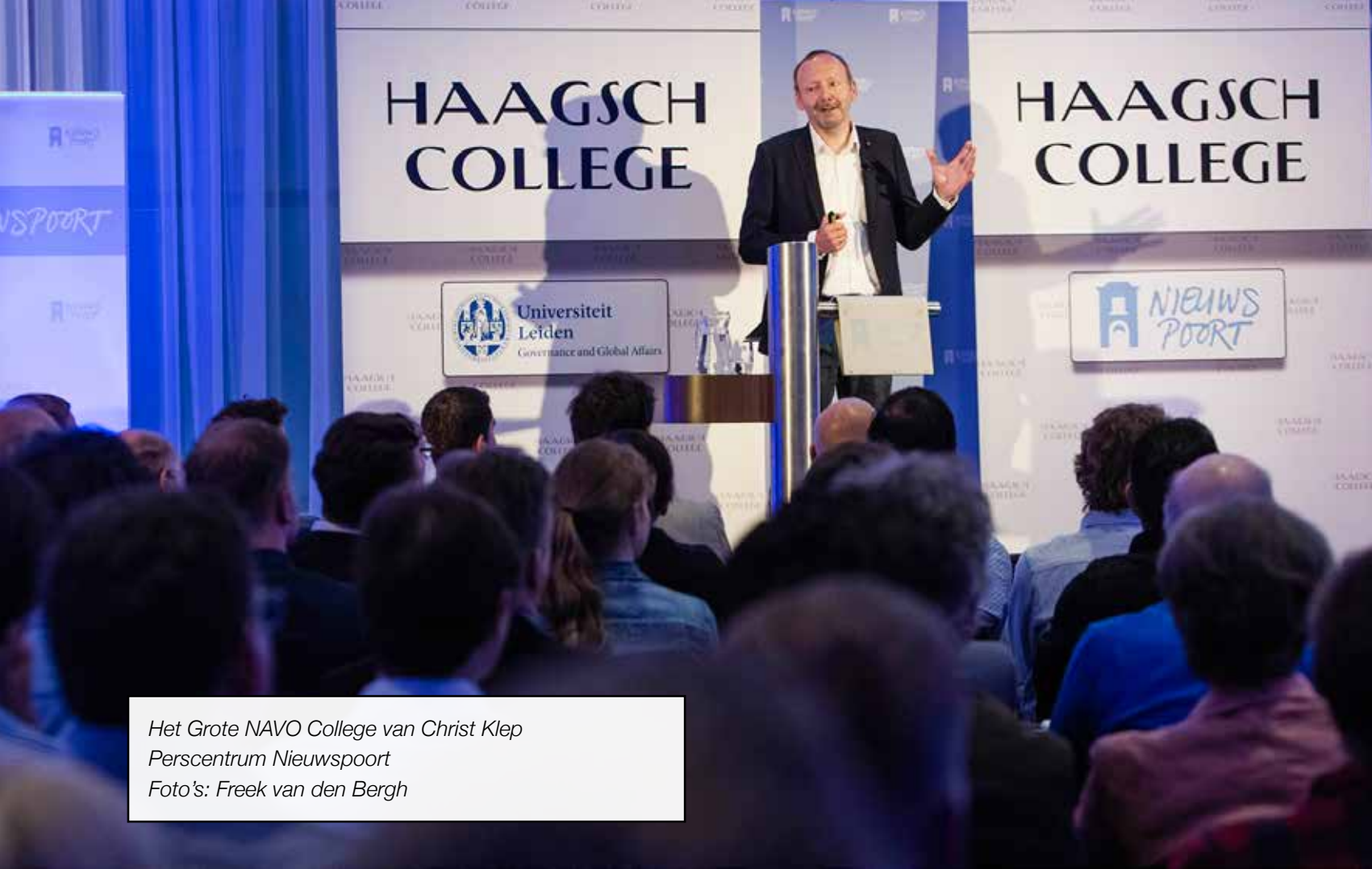
Het Grote NAVO College van Christ Klep Perscentrum Nieuwspoord