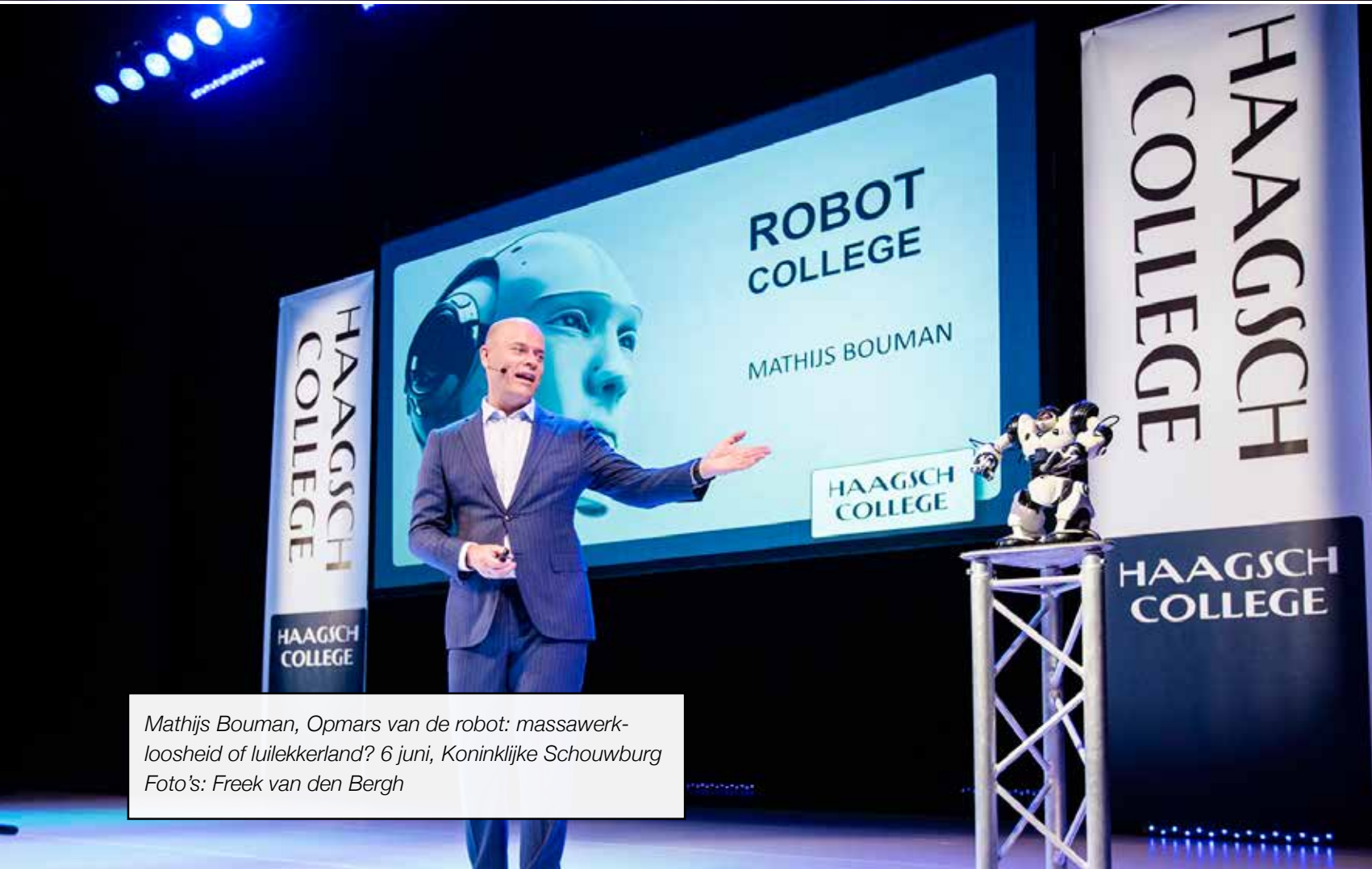
Mathijs Bouman, Opmars van de robot: massawerk- loosheid of luilekkerland? 6 juni, Koninklijke Schouwburg