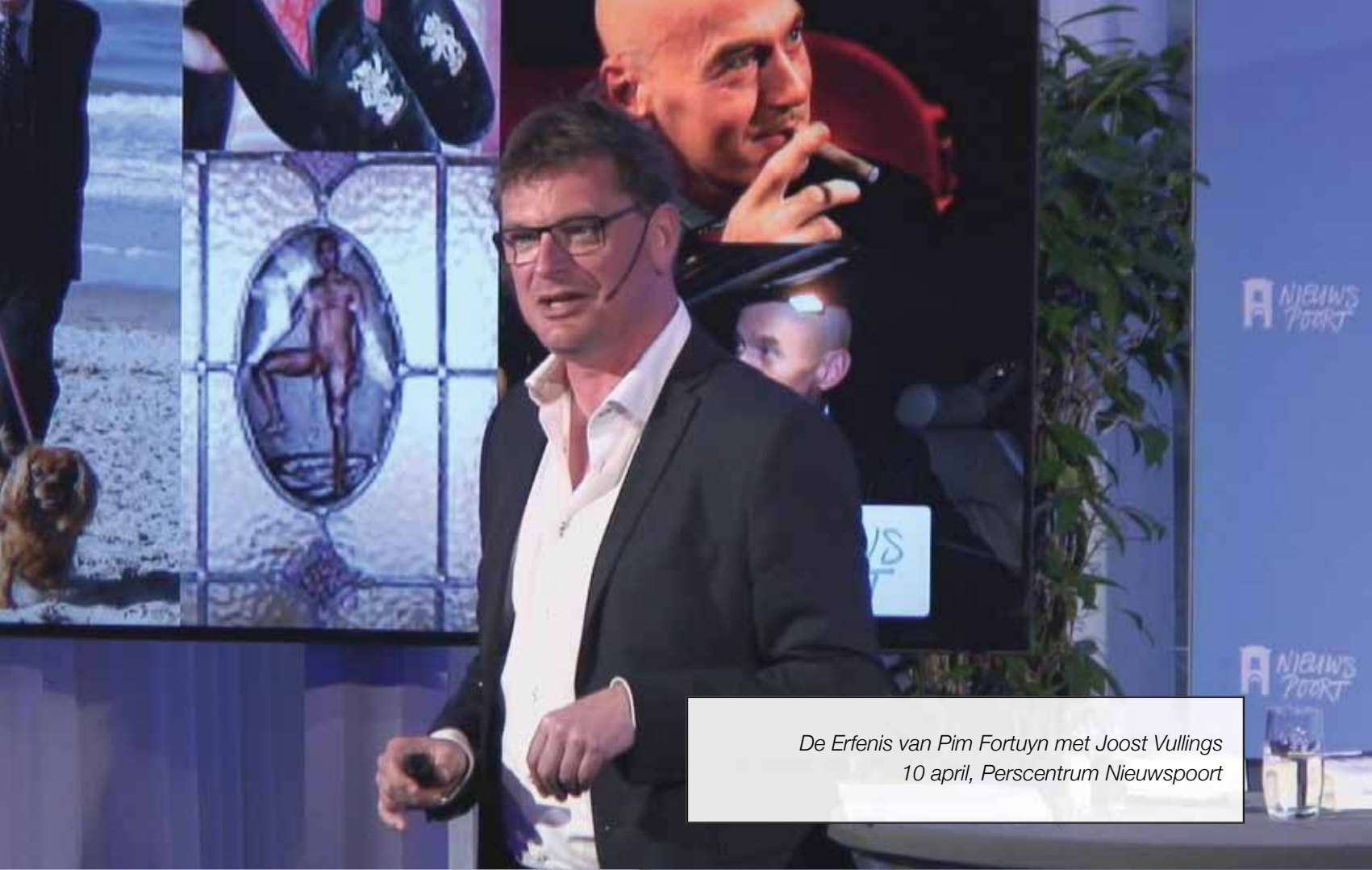
De Erfenis van Pim Fortuyn met Joost Vullings 10 april, Perscentrum Nieuwspoor