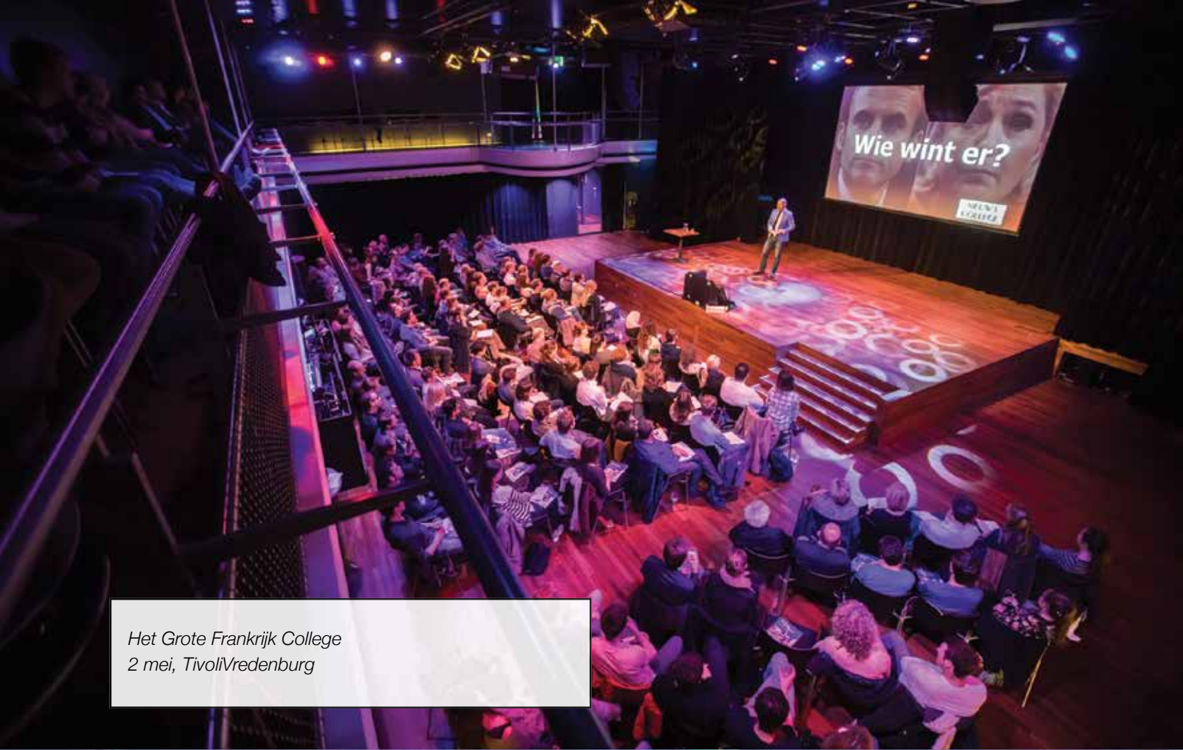
Het Grote Frankrijk College 2 mei, Tivolivredenburg