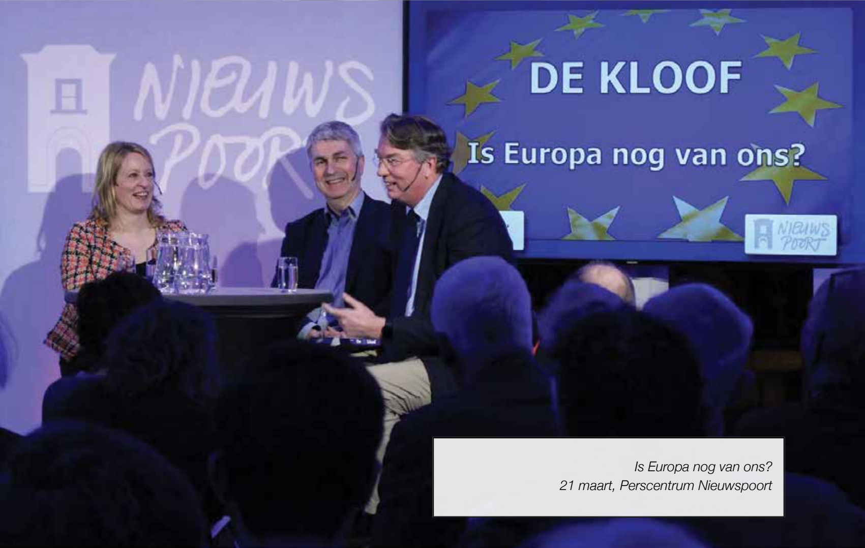
Is Europa nog van ons? 21 maart, Perscentrum Nieuwspoor