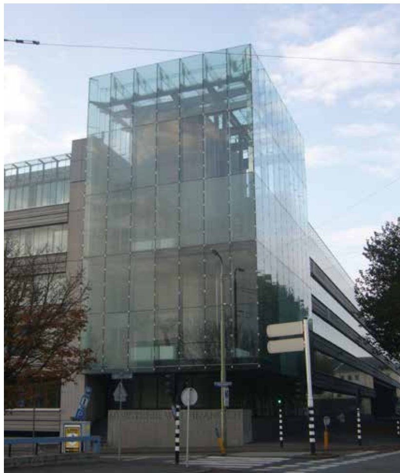
Ministerie van Financiën

Het ministerie van financiën speelt een centrale rol bij het vertalen van het algemeen regeringsbeleid in financieel beleid. Daarnaast coördineert het de openbare uitgaven en zorgt het ministerie voor de inning van de belastinggelden.