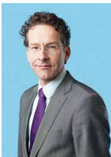
Minister van Financiën Dijsselbloem

Ministers zijn politiek verantwoordelijk voor een bepaald beleidsterrein. Met uitzondering van ministers zonder portefeuille geven zij politieke leiding aan een departement. Daarbij kunnen zij terzijde worden gestaan door staatssecretarissen. Een minister, meestal lid van één van de partijen die in de Tweede Kamer het kabinet steunen, moet het vertrouwen van de Tweede Kamer hebben om zijn functie te kunnen vervullen.