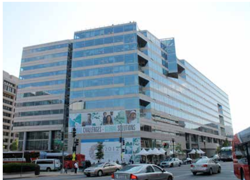
Hoofdkwartier van de IMF in Washington D.C.

Naar aanleiding van de Griekse problemen werd het tijdelijke noodfonds EFSF voor eurolanden en uiteindelijk ook een permanent noodfonds opgericht. De lening van 110 miljard euro aan Griekenland kwam echter nog niet uit die fondsen.