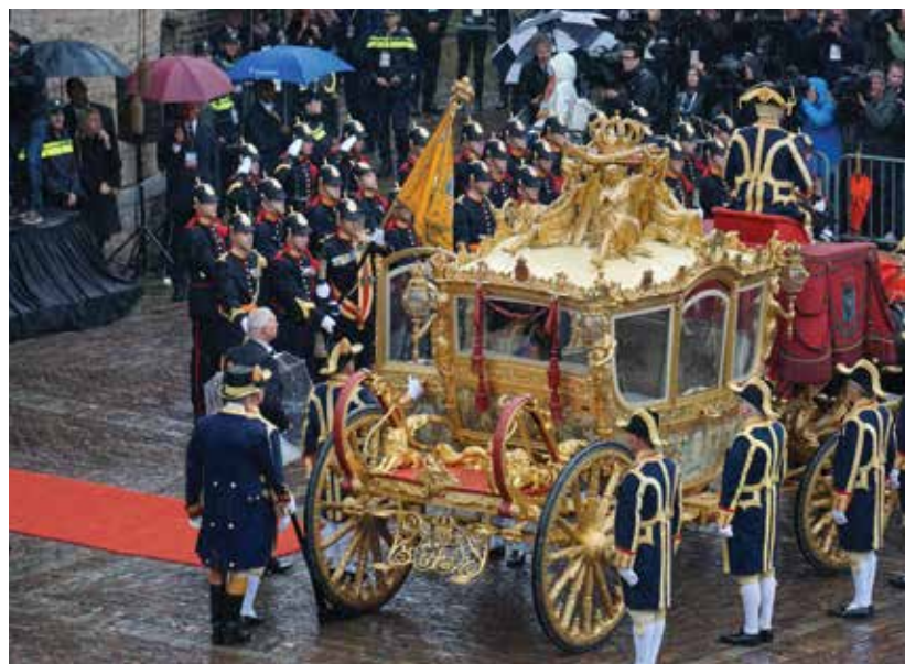
Prinsjesdag 2015

Volgens de Comptabiliteitswet van 2001 hebben begrotingen betrekking op een begrotingsjaar en bestaan ze uit een aantal onderdelen, namelijk een begrotingsstaat waarin begrotingsartikelen zijn opgenomen en een toelichting bij de begrotingsstaat. De begrotingsstaat wordt bij wet vastgesteld.