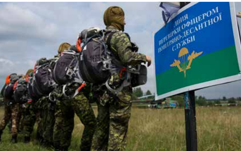
Navo militairen Oekraïne – Bron: U.S. Army Europe Images

Hoewel veel van haar lidstaten behoorlijke bezuinigingen op gewapende strijdkrachten doorvoerden, blijft de NAVO met een gezamenlijke militaire uitgave van ruim een biljoen dollar en 3,4 miljoen soldaten nog steeds verreweg de grootste militaire macht ter wereld. Dit is wel voor het grootste gedeelte aan de Verenigde Staten te danken. De grootmacht is goed voor 70 procent van de totale defensie uitgaven van de 28 lidstaten van de NAVO.