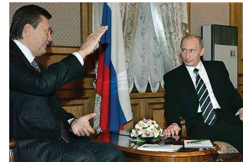
Poetin en Janoekovitsj

In december tekende Janoekovitsj wel een plan met de Russen om te komen tot een vrijhandelsovereenkomst.