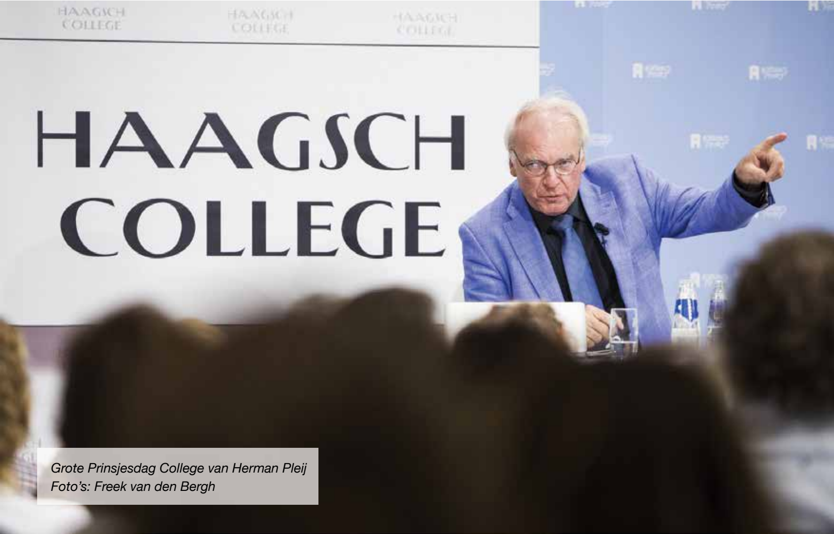
VredesCollege van Tom Middendorp