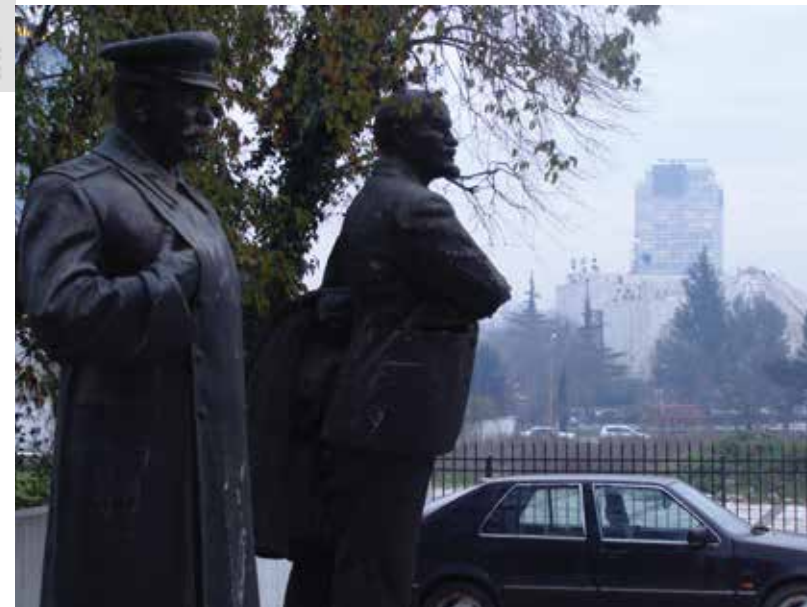
Standbeeld Stalin & Lenin

Na Stalins dood in 1953 kwam Nikita Chroesjtsjov aan de macht die brak met het Stalinisme. Hij werd in 1964 opgevolgd door Leonid Brezjnef. Na enkele kortstondige leiderschappen trad in 1985 de hervormer Michail Gorbatsjov aan. Hij streefde naar meer openheid, maar probeerde wel de Sovjet-Unie als eenheid in stand te houden.