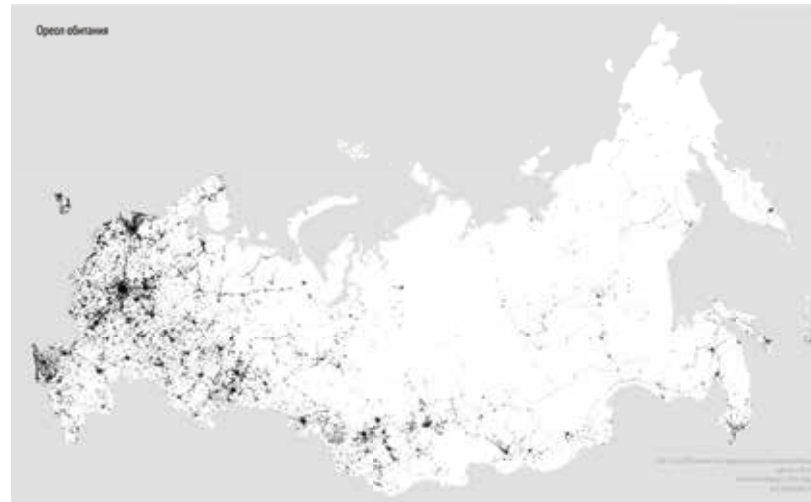
Kaart Rusland bevolkingsdichtheid

Qua oppervlakte is Rusland met ruim 17 miljoen vierkante kilometer het grootste land ter wereld. Het land beslaat een groot deel van Azië en kent een kleiner Europees deel. Met 142 miljoen inwoners blijft Rusland qua inwonertal evenwel achter bij China, de VS en India.