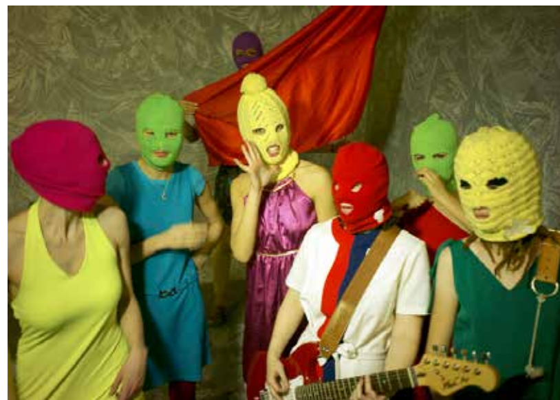
Pussy Riot Rusland

Een ander voorbeeld is de veroordeling van leden van de band Pussy Riot in 2012. Met een optreden tijdens een kerkdienst in Moskou protesteerden zij onder andere tegen de herverkiezing van president Vladimir Poetin. De leden van de band werden gearresteerd en verbannen naar een strafkamp. Eind december 2013 werden de bandleden vrijgelaten.