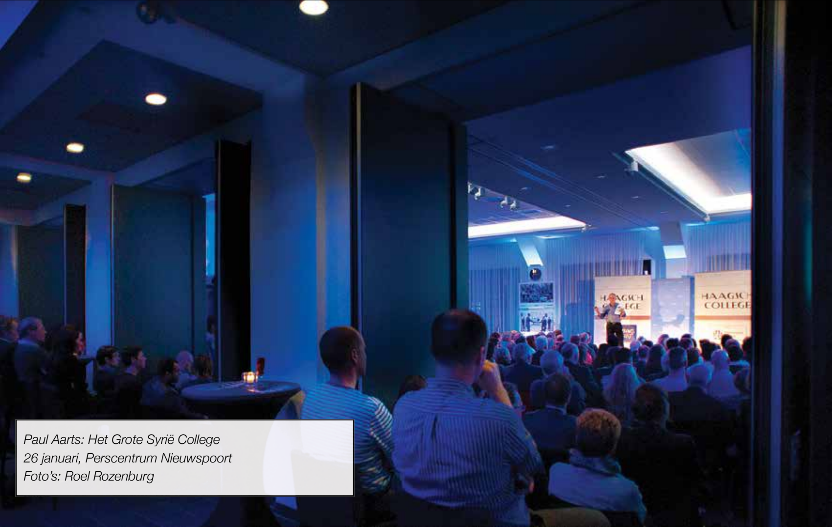
Paul Aarts: Het Grote Syrië College 26 januari, Perscentrum Nieuwspoord